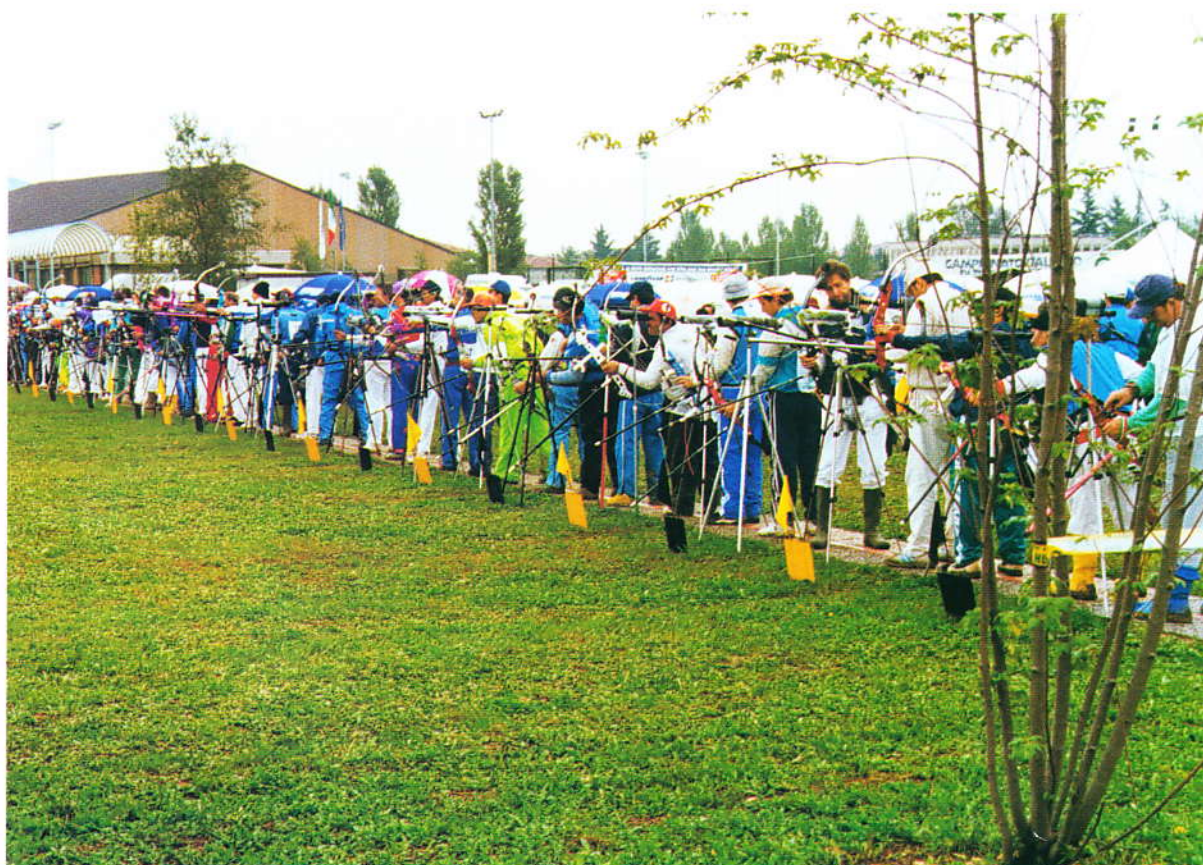
Il campo di Urygano (Bergamo) che nel 1996 ha ospitato i Campionati Italiani Compound

riscosso molto successo fra atleti e tecnici e che per inciso ha premiato particolarmente le compagini lombarde. Credo che iniziative di questo genere non possano che giovare all'intero movimento salvaguardando le motivazioni in attesa di tempi migliori. Inutile sottolineare che le figure degli arcieri già da tempo in attività sono da considerarsi come assolutamente necessarie alla levitazione numerica e non. Il bagaglio di esperienza accumulata da chi da anni calpesta i campi di tiro di tutto lo stivale è il nostro bene più prezioso, la nostra vera ricchezza che vorremo "sfruttare" nel senso migliore del termine, per consolidare la nostra realtà agonistica che, lo ricordo, ci assorbe per il sessanta per cento del nostro impegno. Ci auguriamo che durante questo cammino i contatti con la Federazione diventino più fitti e diretti e speriamo che i Comitati Regionali possano riappropriarsi di quella identità che anche istituzionalmente appartiene loro. Nel frattempo teniamo duro forti del consenso offertoci dai nostri stessi iscritti, dall'entusiasmo dei nostri giovani e dalla efficiente concretezza di chi per loro e con loro opera per 365 giorni all' anno. Sappiamo di agire per il meglio, i nostri scopi sono chiari e parlano di amore per questa disciplina, un amore al quale, per quanto possa risultare complicato, non abbiamo nessuna intenzione di rinunciare. Buon lavoro a tutti ". □